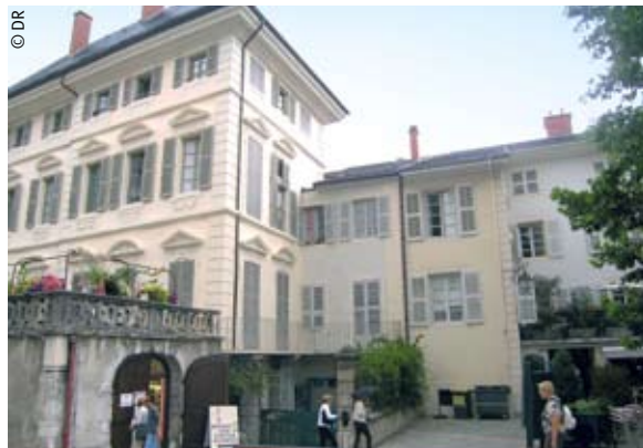
Un îlot complet a fait l'objet d'une restructuration lourde